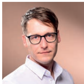
Kantor Philipp Göbel