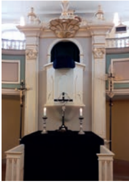
Altargestaltung am Karfreitag mit maßgefertigtem Parament aus dem 19. Jahrhundert